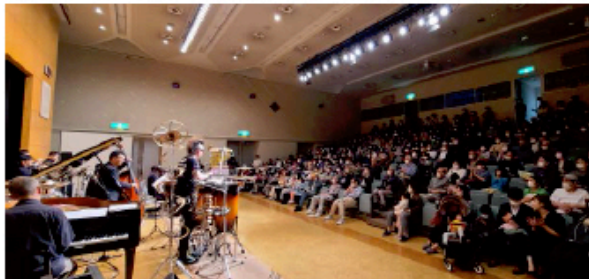
第2回元住吉ミュージック・フェスティバル-2023の演奏風景

元住吉ミュージック・フェスティバル -2025 2025年4月19日(土) 11:00~20:00 (MMF -2025)