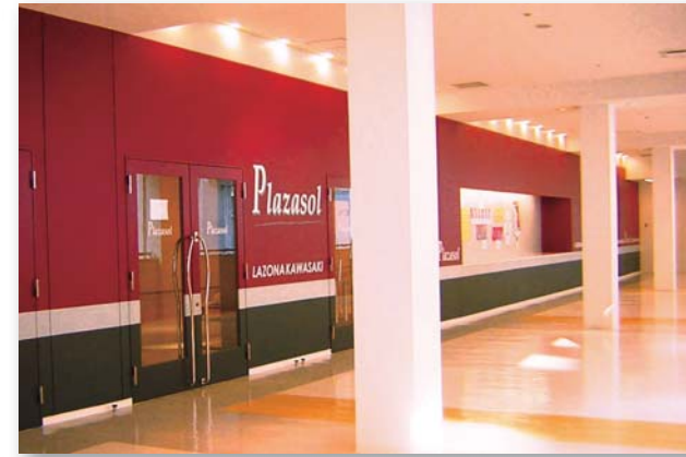
ラゾーナ川崎プラザ5F・プラザソル入口付近

※全日利用が基本ですが、文化・芸術等利用に限り3ヶ月前から午前・午後・夜間の分割利用を受付けます。 ※一日2ステージ以上の場合、上記基本料金より20%割増となります。 ※午前10時～午後10時の利用時間帯以外の延長利用は、追加料金が必要になります。 ※付帯設備(舞台・照明・音響等)及び使用料は、当館ホームページでご確認いただくか、直接お問合せください。 ※上記料金等は平成27年6月1日現在のものです。