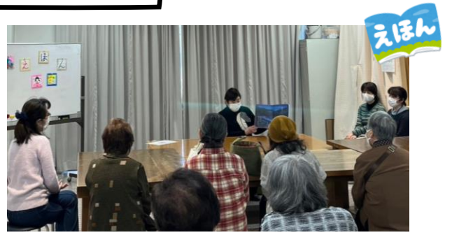
「冬の絵本読みきかせ会 ～冬をテーマにした絵本を楽しみましょう～」

どの会も幅広い年代の方にお越しいただき、 楽しい時間を過ごしました。 ご参加のみなさん、ありがとうございました。