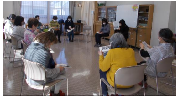
「カラダのことを考えてみよう! ～コグニサイズ(頭と身体エクササイズ)～」

※ 令和6年6月以降の開催日程・内容については、 今後のチラシまたはホームページをご覧ください。