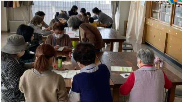
「折り紙で「おひなさま」作りましょう!」