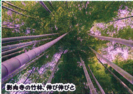
影向寺の竹林、伸び伸びと