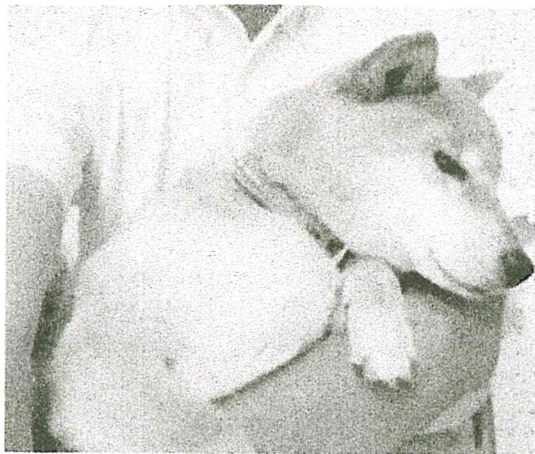
【キャラクター ユータン】